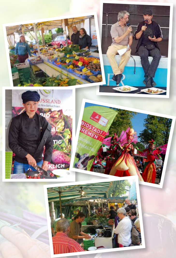
Kooperationsraum der Metropolregion Nordwest | Bildnachweis: Biostadt Bremen, Horst Pohl, Richard Verhoeven